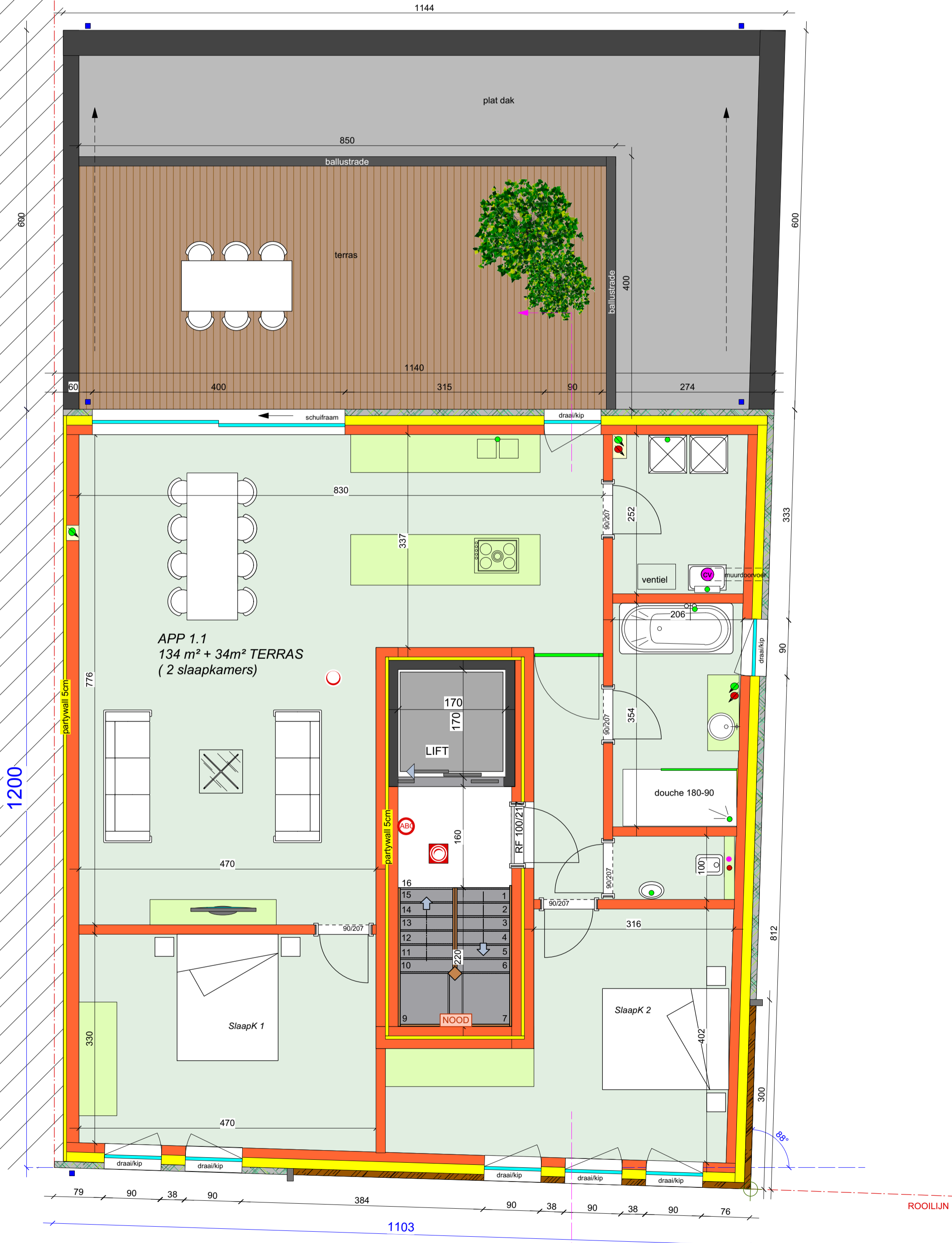
PLAN VERDIEP schaal 1/50